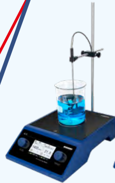
WH380 / WH385