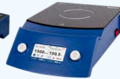
WH390 / WH390-NH / WH395